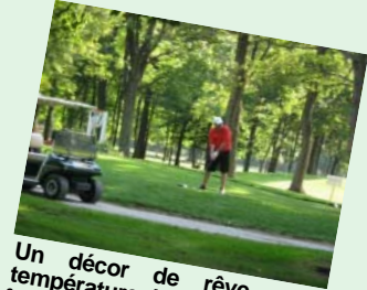
Un décor de rêve, une température idéale... Il n'en faut pas plus pour rendre chacun de bonne humeur et prêt à démontrer son adresse.