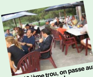
Au 19 ième trou, on passe aux choses sérieuses!